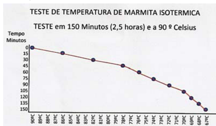
Gráfico correspondente ao teste efectuado nas Marmitas Isotérmicas